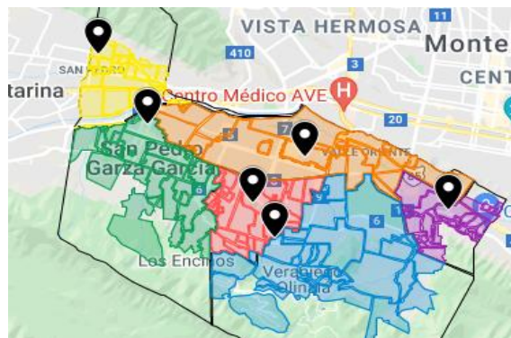
Fig. 2 División de 6 Sectores en San Pedro | Fuente: Secretaría de innovación y Participación Ciudadana

Adaptar CÓNUL, software cívico libre, para transparentar presupuestos, facilitar etapas de proponer proyectos (1 mes), evaluar su factibilidad (1 mes), votar (2 semanas) y ejecutar (18 meses), garantizó el derecho a la participación de todos los ciudadanos del Municipio (figura 3).