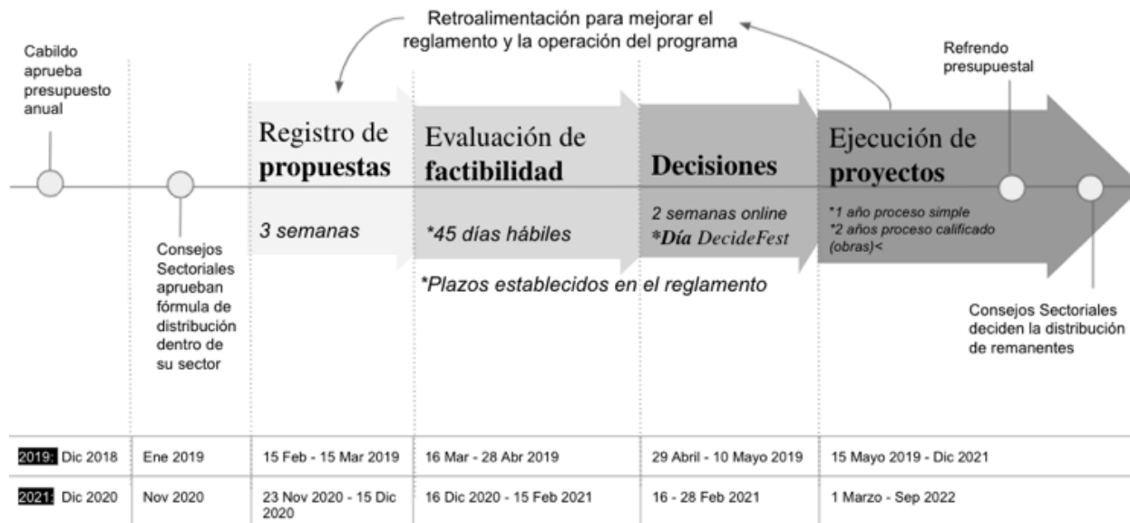
Fig. 4 Proceso del Presupuesto Participativo en San Pedro | Fuente: secretaría de innovación y Participación Ciudadana