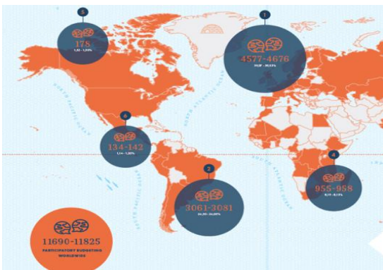
Fig. 1 Atlas Mundial Presupuesto Participativo

El sitio Decide San Pedro se llevó a cabo con el apoyo de Codeando México, una comunidad regiomontana y nacional de hackers cívicos, que descargó el software y lo fue adaptando para el ejercicio del presupuesto participativo de nuestro Municipio.