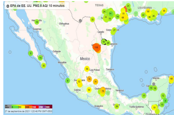
Fig. Mapa Calidad del Aire tiempo real

cercanas están en la zona de Obispado (Monterrey) y en la zona de Palo Blanco (San Pedro).